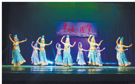
“五月的鲜花”活动中，职工大秀舞技