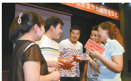
素质提升行动推进仪式后，职工畅聊