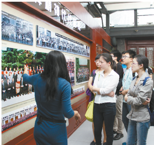
组织职工参观时传祥纪念馆