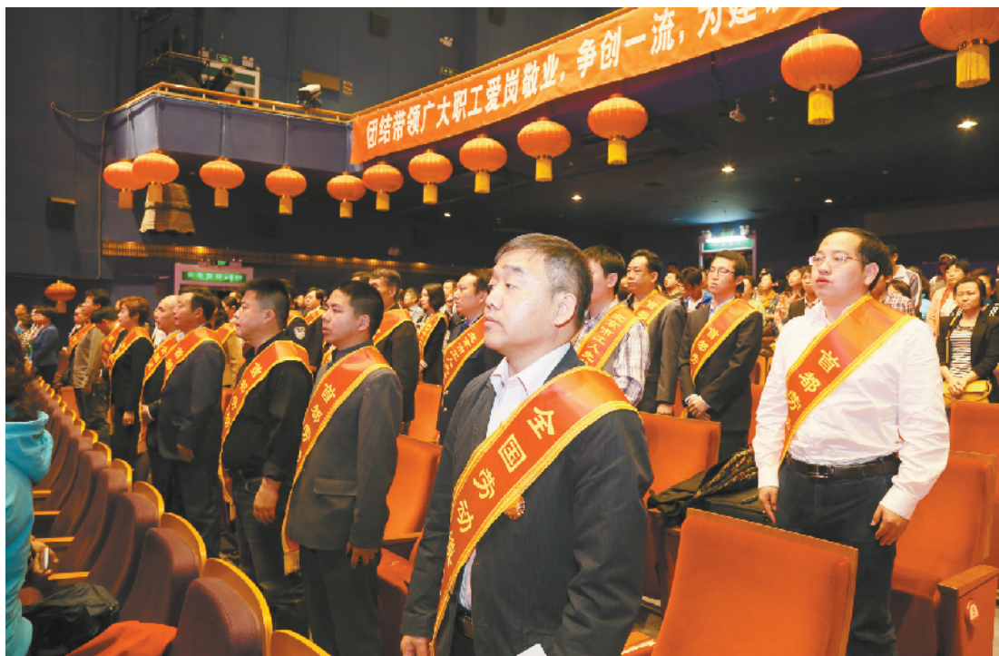
区总工会2014年劳模表彰大会

从职工最关心的工资集体协商，到维护职工根本权益的法律服务；从贯穿全年的项目制帮扶，到遍地开花的职工文化建设，2014年，东城区总工会始终坚持“三个三”的工作理念，强化融入基层、融入实际、融入职工的工作作风，不断提高服务职工的能力和水平，实现了工会工作在职工中的认知度和影响力的不断提升。本报将分上下两期对东城区总工会2014年工作进行盘点。