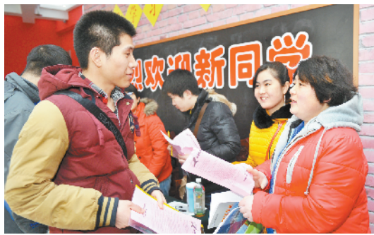
农民工助推计划帮助职工圆梦