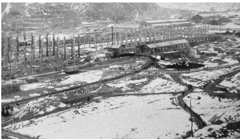
1972年年关，职工们仍然战斗在冰天雪地的工地上。