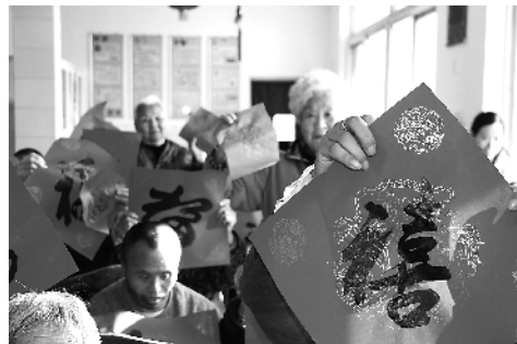
朝阳门街道 总工会关爱老人

曹雪芹文化艺术节是以曹雪芹《红楼梦》文化为主题，推广中华优秀传统文化为宗旨的一项大型文化活动。