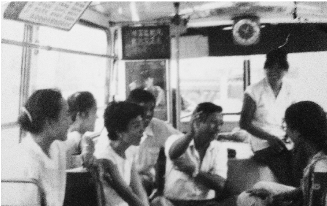
上世纪八十年代中期，44路小环3737车组人员正在公交车上开午间会。中间抬手讲话者为车队长，右一为笔者。