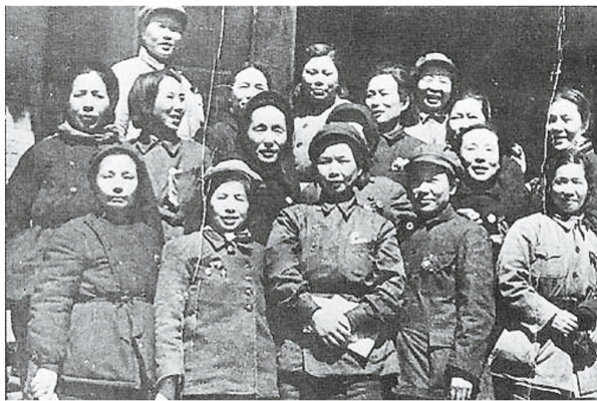
这是妇女独立师部分成员合影