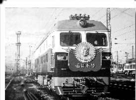
第四代“毛泽东号”2000年