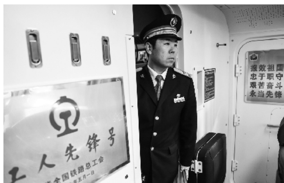
“毛泽东号”也是铁路工人的先锋号