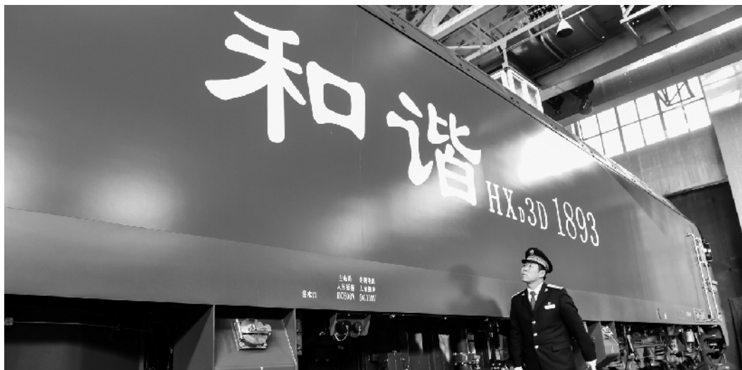
机车两侧机身就像冉冉升起的太阳