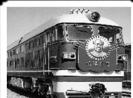
第三代“毛泽东号”1991年