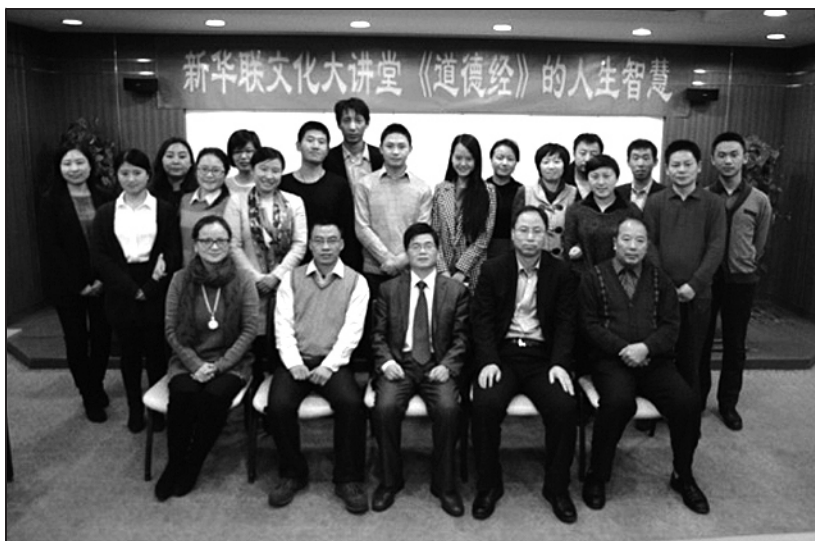
□本报记者 刘欣欣 文/摄

点评：为游客提供高质量服务，不是一时的做法，需要的是坚持。而这种坚持，也是要有技巧和方法，而刘绍晨的做法关键在于真诚。