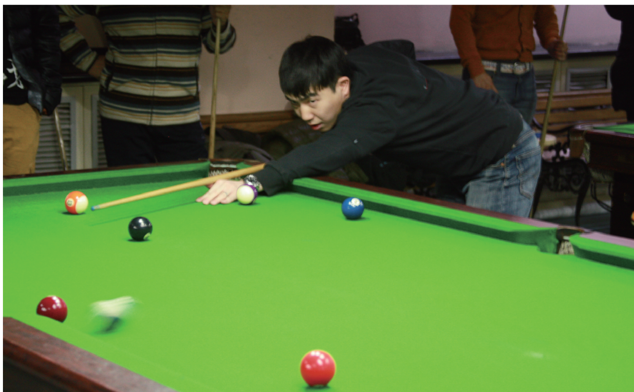
选手边打球边看着白球的走位