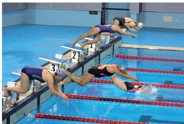
一声令下女职工们争先恐后的下水了