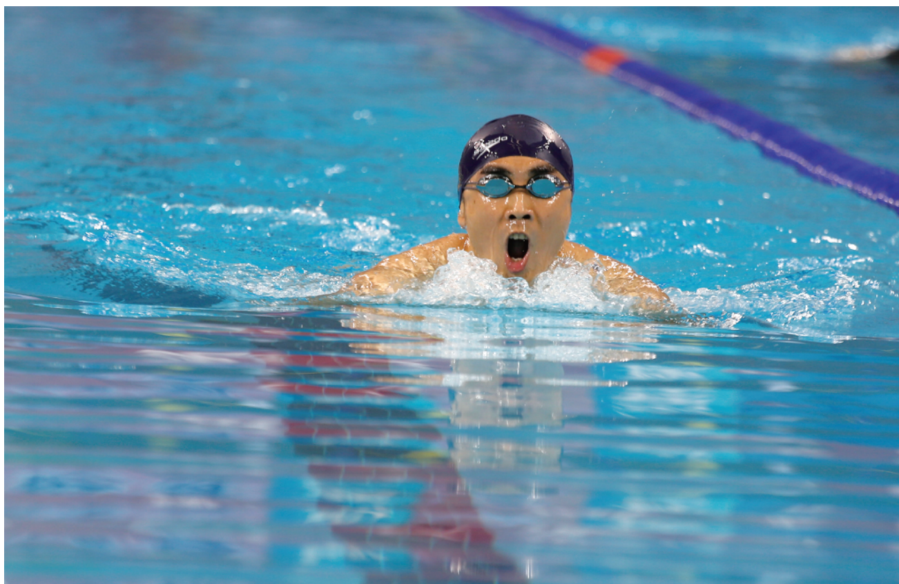
比赛中展现职工别样地拼搏