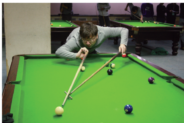
架杆被选手使用的非常自如