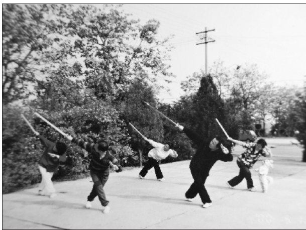
2000年，我在公司教同事们练太极拳。