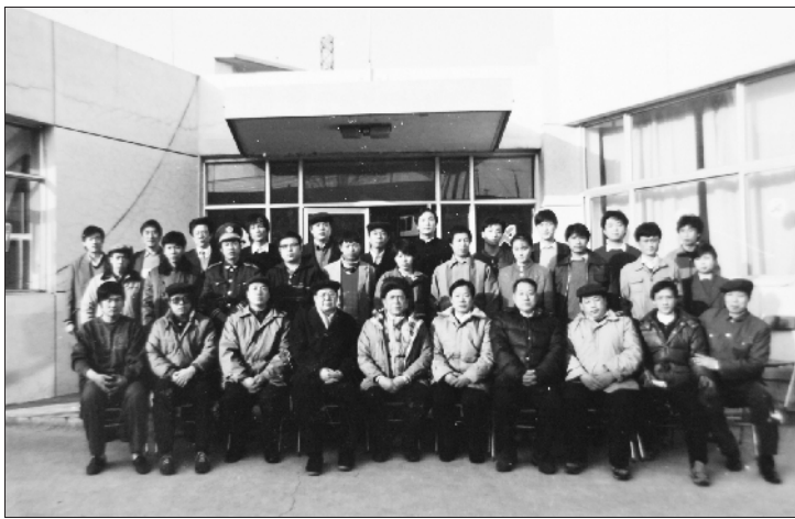
拜师仪式后，我们师兄弟与师爷师父等人的合影。

转眼间，20多年过去了，如今我已经退休了，太极拳我仍然在打，这已经成为我生活中不可或缺的一部分。太极拳给我带来了健康，太极拳给我带来了快乐。