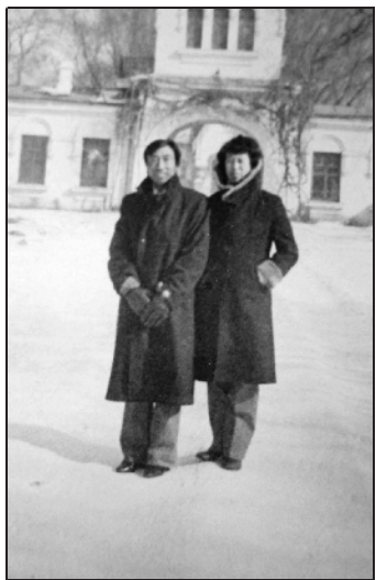
穿着呢子大衣度蜜月回来