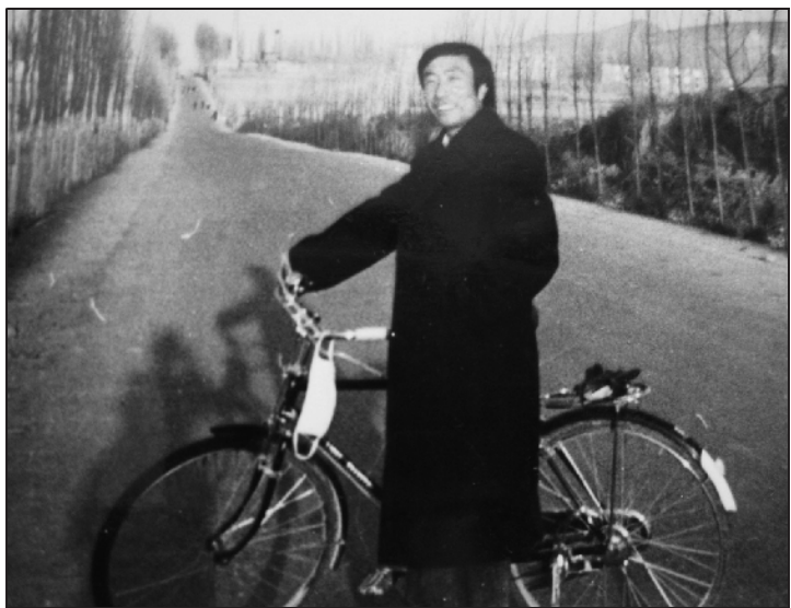
拥有了一辆心爱的凤凰牌自行车