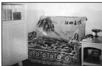
自制沙发的第一代“总设计师”