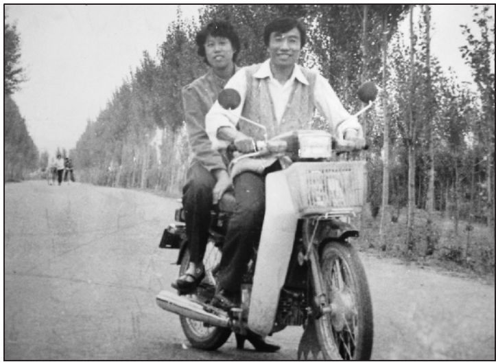
带妻子骑上“嘉陵”去兜风