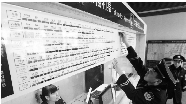
图为工作人员在西直门站张贴票价表。

此次新票制,还调整了儿童免票身高,将儿童乘车免票的身高标准由原来的1.2米提高到了1.3米。在西直门站,新的儿童免票标识已经张贴完成。