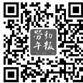
扫描二维码关注本报微博