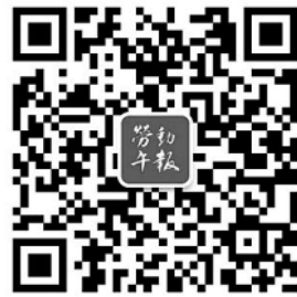
扫描二维码关注本报微信