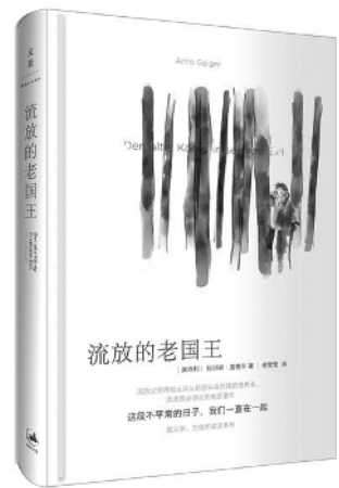
《流放的老国王》 阿尔诺·盖格尔