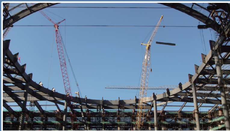
《我们的杰作》

他们是一线职工，他们也是摄影爱好者。当他们端起照相机的時候，一股暖流涌上心头。因为对职场对生活的热爱。