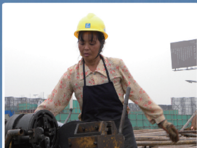
《巾帼劳动者在行动》

工会的摄影比赛的通知一出，分散在各地的职工都纷纷响应，邮箱里的邮件一封又一封，工作上专业的交流，在这里则是心灵的交流，感情的共享。