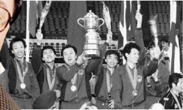
许绍发作为总教练率队夺39届世乒赛男团冠军