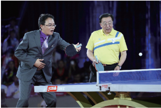
许绍发与央视体育节目主持人蔡猛一同打球