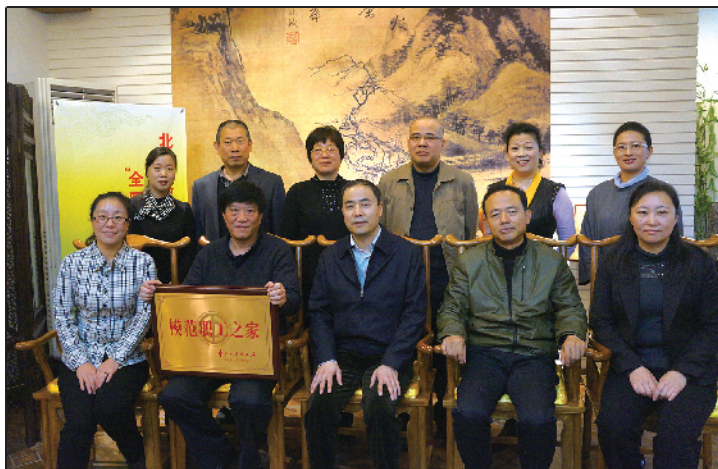
专家组与西城区教育工会工作人员合影留念。

在市区工会支持下，在教工委、教委的帮助下，区教育工会建立了2个“教工之家”，并对“教工之家”进行定位：区教育工会工作设施，承办教育工会系统工作研讨及交流活动；区教育工会活动场所，承办各类文化沙龙（笔会、书法、绘画、音乐