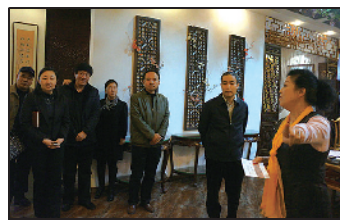
专家组对西城区教育工会“职工之家”工作进行专题验收。

等）以及劳模、先进人物学习培训中心；区教育工会接待设施，组织来访交流联谊活动；把西城区教育工会教职工之家建成研习创新的实验基地，开展广大教职工喜闻乐见的社会主义核心价值观教育、传统文化知识的普及与展示（如茶文化、石文化、壶文