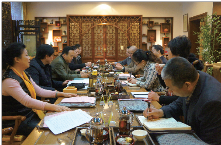
西城区教育工会就“职工之家”工作向专家组进行汇报。