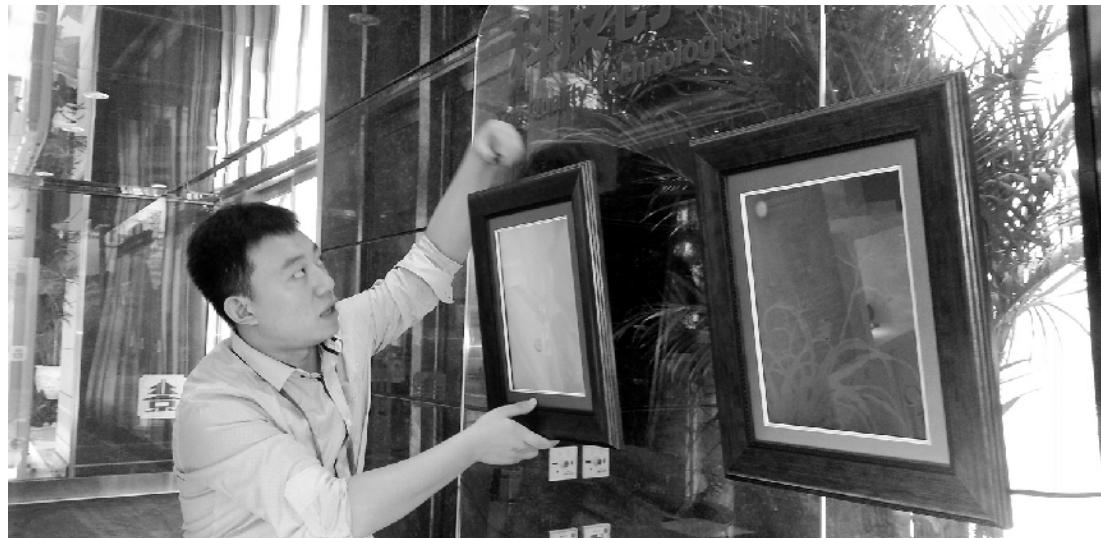
工作人员安放牡丹设备——15寸数码动态媒体艺术画