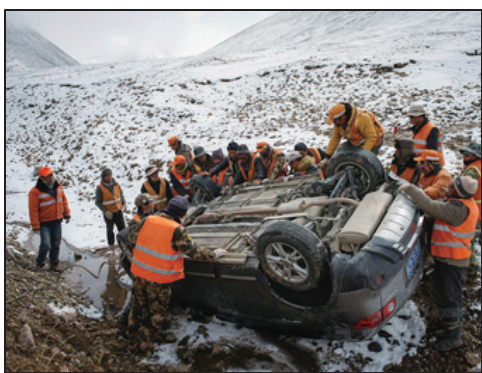
道班职工合力将事故车移到安全地带