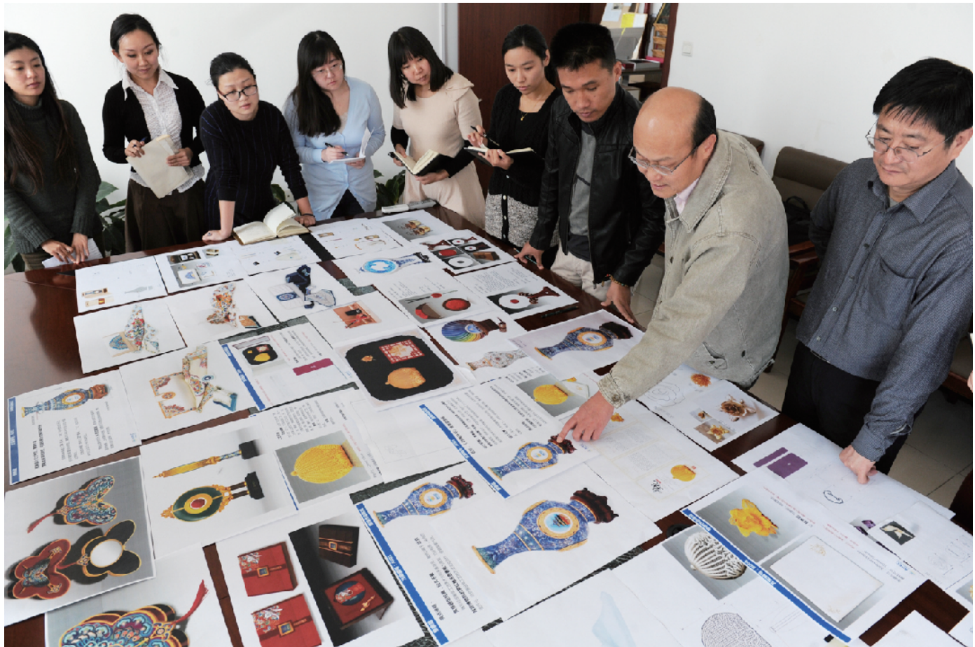
每一个设计细节工艺师团队都要反反复复进行讨论、推敲，力争完美。