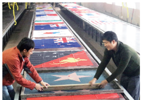
两名工人用大刷板给布料上色。