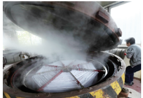
制作APEC旗帜需要裁剪、印染、蒸制、水洗、缝制、熨烫、整理等8道工序。