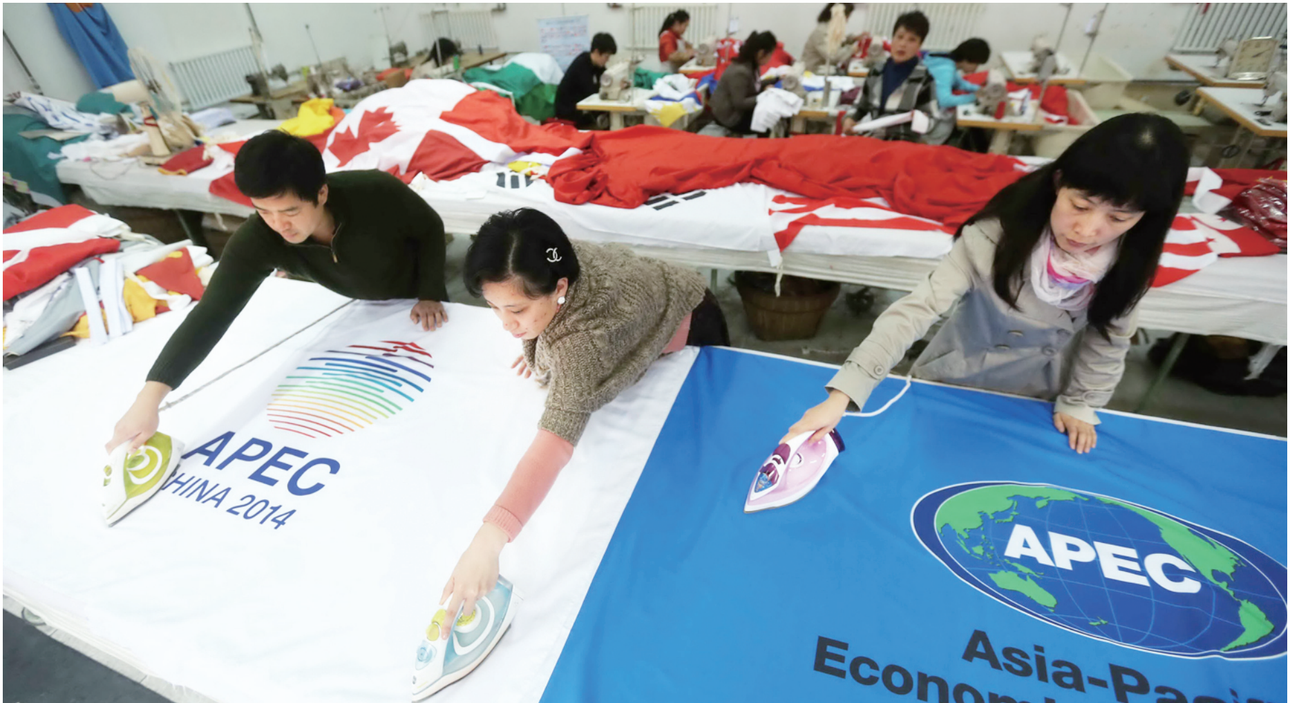
在制作车间，职工把APEC会旗熨烫平整。