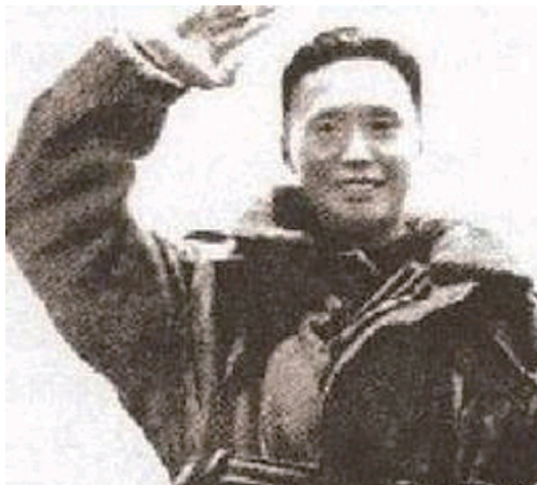
东征队长徐焕升凯旋归来