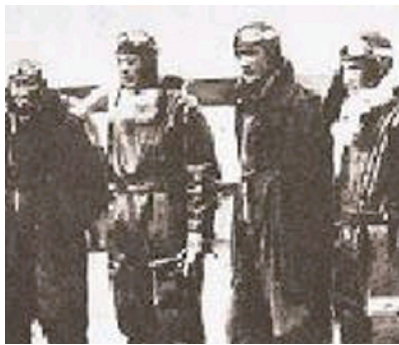
待命出发的中国飞行员

1938年5月20日清晨，日本长崎、福冈的居民发现街道上、屋顶上到处是传单。好奇心使市民们争相捡起诵读。日本本土，怎么会有中国的传单出现？日本法西斯当局派出大批军警、特务挨家挨户收缴传单。原来，这是中国空军实施“人道远征”空袭日本的非常行动。它成为世界航空作战史上绝无仅有的一次“纸片轰炸”。