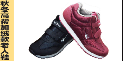
秋冬高帮加绒款老人鞋