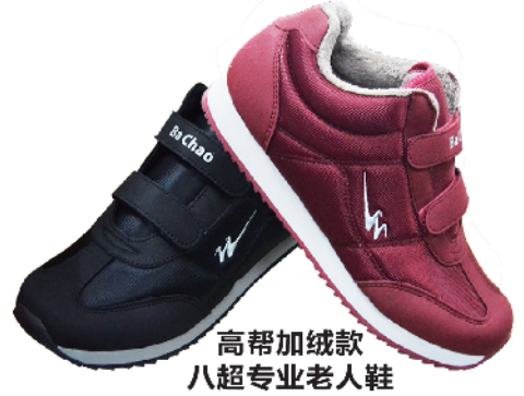
高帮加绒款 八超专业老人鞋

冬季来临, 为了帮助京城老人更好的度过一个温暖的冬天。双星名人在八超专业老人鞋耐磨、防滑、舒适、安全的基础上, 进一步研发出一款高帮加绒款专业老人鞋。内里采用优质保暖绒毛, 柔顺毛密, 有效锁住温度, 保证温度不流失, 持久保温有效抵御寒冷。鞋底采用超软橡胶大底, 柔韧性好, 老人踩下去不会硬邦邦, 自然舒适。超强透气性, 透气排汗快, 舒适柔软不闷脚。鞋帮加高, 有效保护脚踝不受伤。鞋底增高设计, 舒适柔软, 结实耐穿, 防水性极好, 不会因雨雪弄湿鞋里。360度包裹双脚, 在寒冷的冬季给您的双脚温暖的感觉。