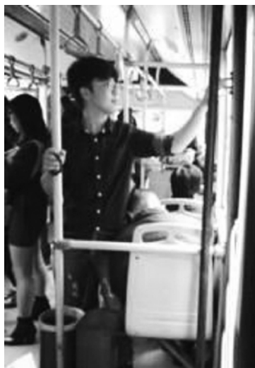
更是这位“暖男”的本色出演。

在我看来，这是这位“暖男”的下意识。因为是一种本能的举动，且自然而然的行为，给人的解读就很多：至少他的家教很好，成长的环境古朴，个人很有修养。所以，这个下意识的本能表达，其实，