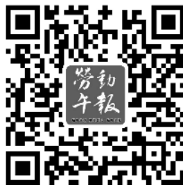
扫描二维码关注本报微博