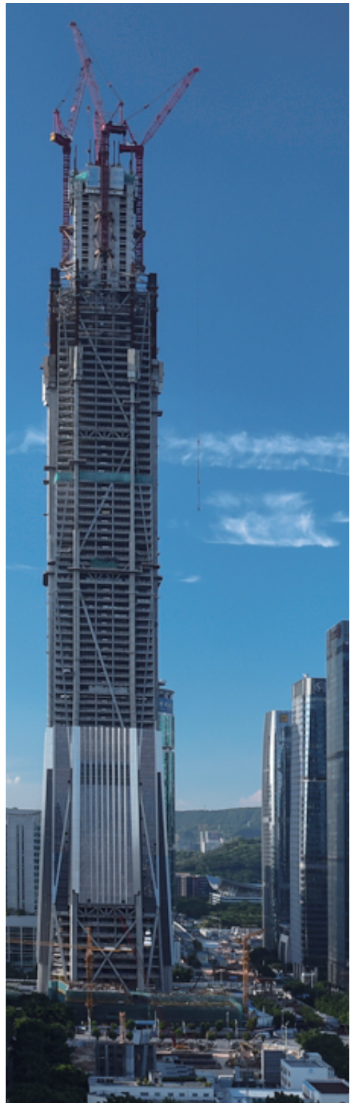
正在建设中的深圳平安金融中心