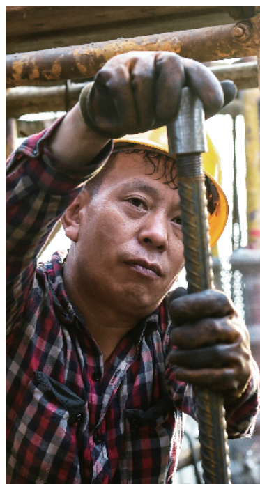
必须做到丝毫不差