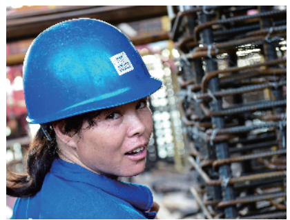
工作在顶层的女工