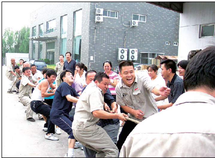
业余时间,工会组织职工开展拔河比赛