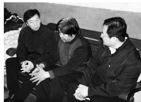
工会慰问困难职工