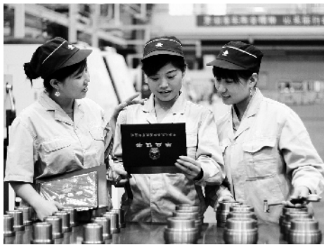
经过培训获得资格证书

四年来，北京京城机电控股有限责任公司工会在公司党委和上级工会的领导下，坚持正确的政治方向，不断提升自身履职能力，始终以围绕中心支持改革、推动发展服务大局为中心，以促进职工发展、服务职工需求为根本，以构建和谐劳动关系、维护职工合法权益为重点，以加强基层组织建设、增强工会组织活力为目标，把工会工作融入到京城机电改革发展的全过程和各环节中。